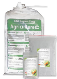
EM Keramik Pulver Super Cera-C 0,15 kg / 1 kg / 20 kg CHF 9.50 / 35.– / 340.–