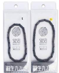
EM Keramik Turmalin- Armband schwarz Klein 18 cm CHF 44.– Gross 20,5 cm CHF 44.–