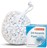
EM Keramik Pipes 100 g / 500 g CHF 11.– / 42.–