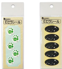
E-SMOG Cera-Seal weiss oder schwarz Set à 5 Kleber CHF 31.–