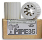
EM Keramik Set Pipe 35 2 Stk. à 3.5 cm CHF 40.–