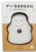
EM Keramik Kagen Platte CHF 54.–